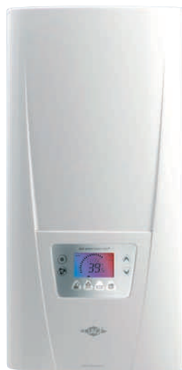
Elektronický prietokový ohrievač DSX pre doohrev solármi predhriatej vody určený do kúpeľne