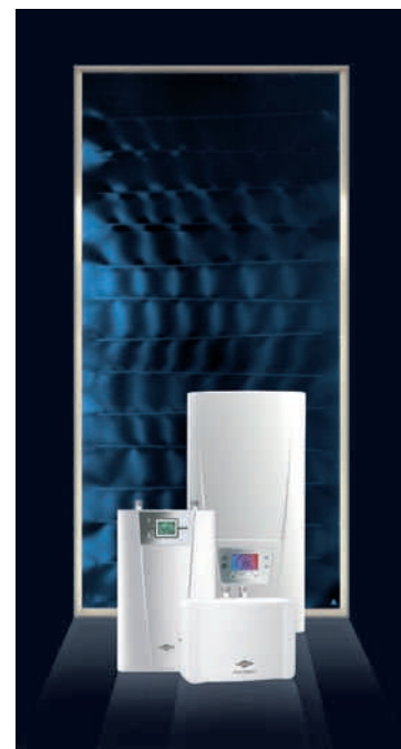
Solárny kolektor SCM 215 s prietokovými ohrievačmi určenými na doohrev solármi predhriatej vody k umývadlám, kuchyniam a kúpeľňam