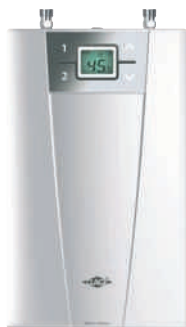
Elektronický prietokový ohrievač CEX-U pre doohrev solármi predhriatej vody určený do kuchyne