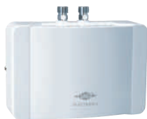
Elektronický prietokový ohrievač MDX pre doohrev solármi predhriatej vody určený k umývadlu

Predhriatá voda vstupuje do elektronicky riadeného prietokového ohrievača a preto bude vždy aj najvzdialenejšie odberné miesto dostatočne zásobené teplou vodou.